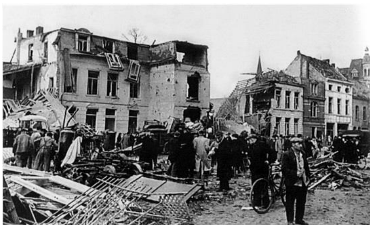
Mortsel, 5 april: Bij een Amerikaans bombardement op de Erlafabrieken komen per vergissing vele bommen op burgerwoningen terecht. De balans is erg zwaar: 936 doden onder wie 200 kinderen, 1342 gewonden, 800 vernielde of zwaar beschadigde woningen.

Indianenhoofd geschilderd, met veren getooid. Dit was zo mooi gedaan en met zoveel expressie van fierheid in dat gelaat weergegeven, dat het niet anders kon: hier moet een kunstenaar aan het werk geweest zijn. Echt een museumstuk. Later vernamen we dat er nog meerdere vliegtuigresten verspreid lagen en dit tot aan de Heikantstraat toe. De Amerikanen hadden een bepaalde techniek om te bombarderen; zij deden aan "area bombing" wat wil zeggen dat wanneer het eskader vlak boven doel was de vluchtcommandant het bevel gaf alle bommen ineens te lossen. Daaronder lag dan alles plat. Maar in Mortsel lag de Erlafabriek niet in het midden van de area. In Duitsland hebben