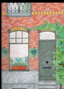
'Blijf in uw kot. Ik meen het, hé. Blijf thuis!' Maggie De Block, minister van Volksgezondheid op 3 maart 2020 'Blijf in uw kot' werd de slogan van de pandemie.

digitaal maar ook op papier aan alle leden van Samana Achterbroek en de Achterbroekse rusthuisbewoners werd bezorgd. Het krantje moest voor verbinding zorgen met elkaar en met het dorp en dit in tijden waar we met z'n allen 'in ons kot' moesten blijven. Dit boek bundelt alle verschenen krantjes, met dat klein beetje meer. Opdat alle verschenen getuigenissen bewaard blijven.