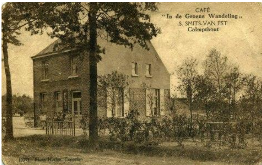
Foto genomen van het café "In de Groene wandeling", deze locatie kennen we nu als het restaurant "De Kar" wat zich situeert op de hoek van de Canadezenlaan en de Putsesteenweg. Zeker ook één van de oudste drankgelegenheden in ons dorp! Als we het gebouw vergelijken met wat het gebouw nu is vinden we nog heel wat gelijkenissen terug.

"Heide vertelt" is een tijdelijke uitgave, gestart als BIN-initiatief tijdens de corona-periode. Verschijnt wekelijks digitaal op zondagmorgen.