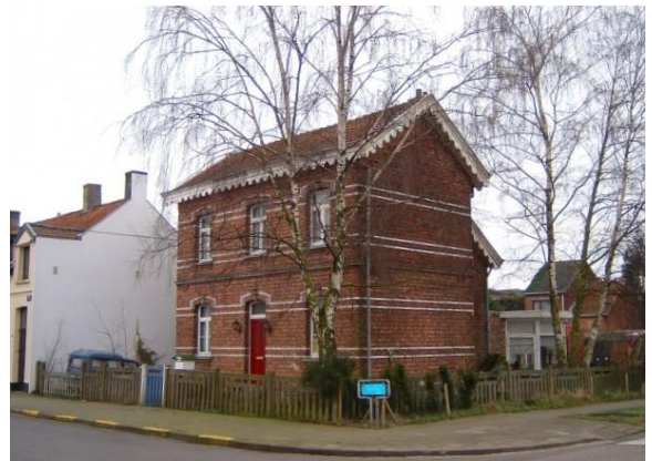
Nog een extra aanvulling: Routehuis (gerestaureerd) in Essen Veldweg/Kerkstraat