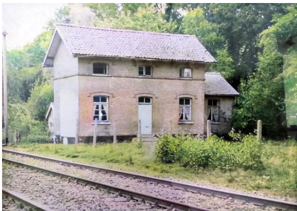
Foto van het routehuis gelegen aan de privé overweg Donnet.

De vijfdelige reeks over de routehuisjes langs Lijn12 lokte zeer veel reacties uit. Dit doet mij enorm veel plezier en ik ben dan ook alle lezers van Heide Vertelt enorm dankbaar. Hieruit mag nogmaals blijken dat Heide Vertelt onze lezers verbindt.