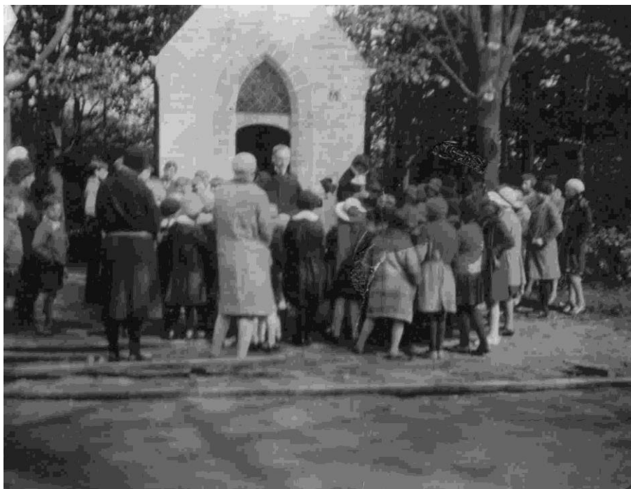
Jaren 1930. Pastoor De Preter met schoolkinderen

vertrokken aanvankelijk nog vanuit het klooster, later vanuit de kerk, in processie. Zij droegen vlaggen mee en waren verkleed in engeltjes, enz. De paternoster of rozenkrans werd gebeden en pastoor De Preter droeg het Allerheiligste onder een baldakijn. Mogelijk ging de processie uit op O.H.Hemelvaartdag? Volgens een kleine, donkere, mogelijk vooroorlogse foto uit het parochiearchief, zien we dat een met bloemen versierd rustaltaar opgesteld werd voor het kapelletje dat nog geen straatnaambord droeg, maar wel het kleine huisnummerplaatje. Naast de leden van de Kerkfabriek in tabbaard en met flambouwen, waren er, paters van het Missiehuis, met koorkleed, die de baldakijn droegen. Twee, bijna zeker paters, assisteerden pastoor De Preter. Allen knielden er voor de verering van het Allerheiligste op het rustaltaar. Op zondag 2.4.1944 onderzocht de Kerkfabriek het financieel overzicht van 1943. Onder de gewone ontvangsten bemerken we: "2) Kapelleken fr. 257,85". Vermoedelijk was het de opbrengst van de offerblok. Volgens het kasboek van de Kerkfabriek brachten de offerblokken in de parochie dat jaar 1.974,95 fr. op. Bij het nazicht op 6.1.1946 van het financieel overzicht van het jaar 1945 vinden we onder de gewone ontvangsten: "3° Kapelleke Fr. 801,60". De offerblokken brachten dat jaar 2.771,90 fr. op. Mogen we veronderstellen dat – zeker tijdens de oorlogsjaren – het kapelletje druk bezocht werd.