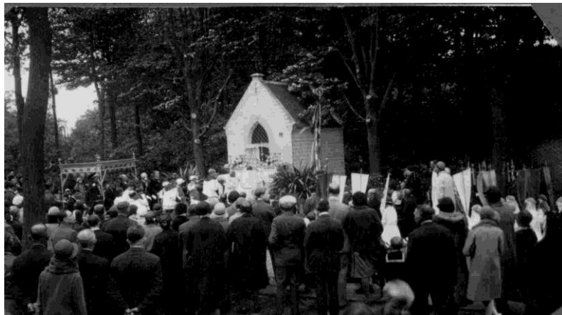
Jaren 1930, pastoor De Preter met processie

vertrokken aanvankelijk nog vanuit het klooster, later vanuit de kerk, in processie. Zij droegen vlaggen mee en waren verkleed in engeltjes, enz. De paternoster of rozenkrans werd gebeden en pastoor De Preter droeg het Allerheiligste onder een baldakijn. Mogelijk ging de processie uit op O.H.Hemelvaartdag? Volgens een kleine, donkere, mogelijk vooroorlogse foto uit het parochiearchief, zien we dat een met bloemen versierd rustaltaar opgesteld werd voor het kapelletje dat nog geen straatnaambord droeg, maar wel het kleine huisnummerplaatje. Naast de leden van de Kerkfabriek in tabbaard en met flambouwen, waren er, paters van het Missiehuis, met koorkleed, die de baldakijn droegen. Twee, bijna zeker paters, assisteerden pastoor De Preter. Allen knielden er voor de verering van het Allerheiligste op het rustaltaar. Op zondag 2.4.1944 onderzocht de Kerkfabriek het financieel overzicht van 1943. Onder de gewone ontvangsten bemerken we: "2) Kapelleken fr. 257,85". Vermoedelijk was het de opbrengst van de offerblok. Volgens het kasboek van de Kerkfabriek brachten de offerblokken in de parochie dat jaar 1.974,95 fr. op. Bij het nazicht op 6.1.1946 van het financieel overzicht van het jaar 1945 vinden we onder de gewone ontvangsten: "3° Kapelleke Fr. 801,60". De offerblokken brachten dat jaar 2.771,90 fr. op. Mogen we veronderstellen dat – zeker tijdens de oorlogsjaren – het kapelletje druk bezocht werd.