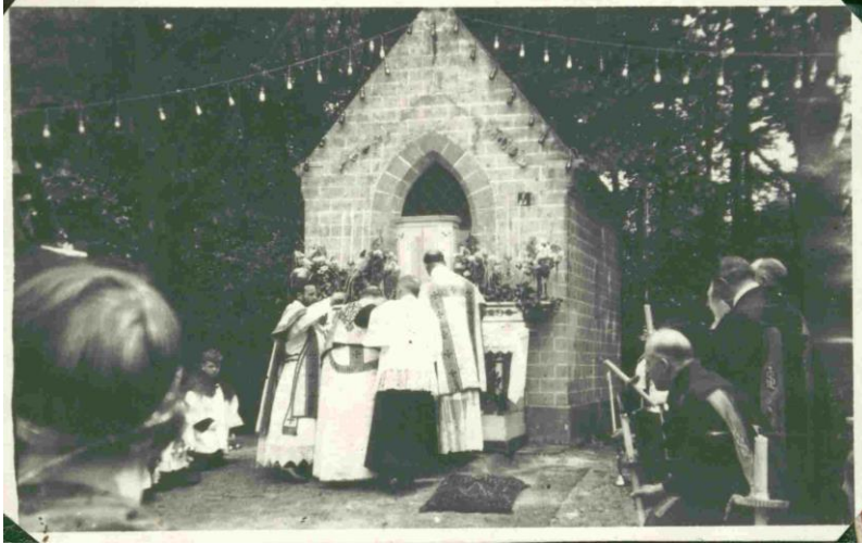
Ca.1950 rustaltaar met processie

Goed begonnen kon men niet meer stoppen. Zo volgde op zondag 2.7.1950 volgende beslissing van de Kerkfabriek: "2° Verlichting in 't Kapelleken aan steenweg.- / Gezien wij nog Crediet hebben bij de Gemeente Kalmthout wordt besloten de niche waar het O.L.V. Beeld geplaatst is met lichtbuizen te verlichten. Het werk wordt toegewezen aan de firma Belmans. Kerkstraat, 25 voor den prijs van f 1.650.- transformateur en alle benodigdheden inbegrepen. De verlichting zal rond de niche aangebracht worden met neon-buizen wit licht" . Een kleine tekening, een grote omgekeerde U over de nis, moest het ontwerp verduidelijken.