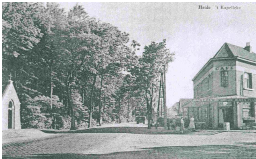
Kapelletje met café 't Kapelleke, postkaart