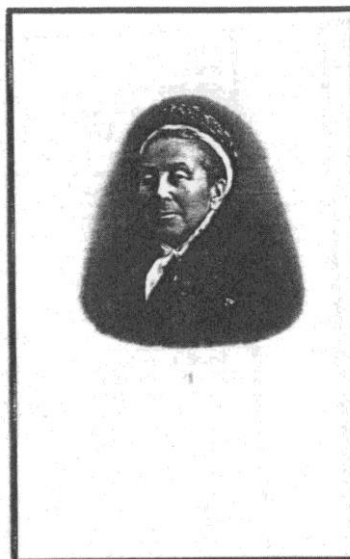
(bijdrage van Lieven Gorissen)