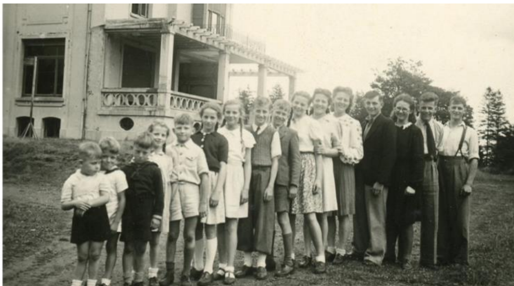
Familiefoto met de kinderen Grauls

Vanuit Grobbendonk kwam de familie Grauls in Achterbroek wonen. Zij huurden het kasteel van de Boerenbond om tijdens de oorlog te kunnen overleven. Het gezin telde 13 kinderen en voedsel was moeilijk te verkrijgen. Op het kasteel konden zij boeren en zelf in hun levensonderhoud voorzien. Vader Grauls was doctor in de scheikunde, maar was van boerenafkomst en kende de boerenstiel. Hij kocht een koe en leerde