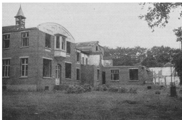
Kalmthout. Het geteisterde Sint-Vincentiusgesticht.