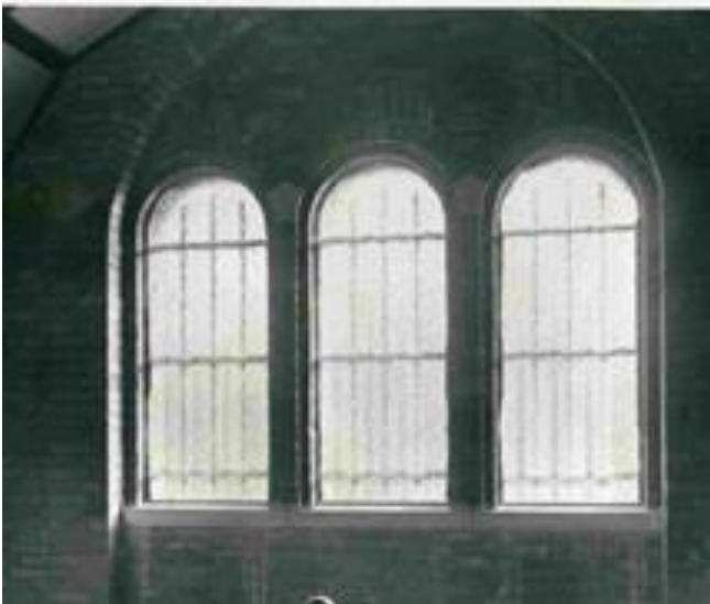
Det. oorspronkelijke glasramen uit mei 1935 architectuur-foto uit Fotoalbum architect L. De Vooght

Aanvankelijk hadden de drie, bovenaan rondbogige ramen langs de Max Temmermanlaan gewoon wit glas. Elk raam was horizontaal in vier gedeeld, en elk raamfragment bestond telkens uit vier naast elkaar opstaande rechthoekige ruiten. Het is niet uitgesloten dat ook deze ramen leden onder de vliegende bommen. De Kerkfabriekraad besliste in zitting van zondag 14.10.1945 "dat er zal aangedrongen worden voor een spoedig herstel der glasramen beschadigd door vliegende bommen", zonder te preciseren over welke ramen het juist ging. In zitting van zondag 6.3.1949 ging de Kerkfabriekraad over tot de " Aanvaarding Glasramen ". – Drie gebrandgeschilderde glasramen welke enigszins beschadigd werden door de bezetting en voortkomende van de private kapel van het Bunderhof,