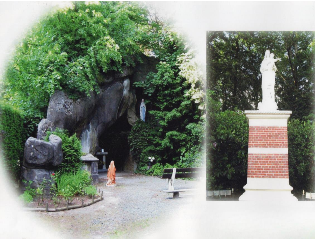
Moeder Gods, Missiehuislei voor 1932

O L V van Lourdes – Missiehuislei – 1938